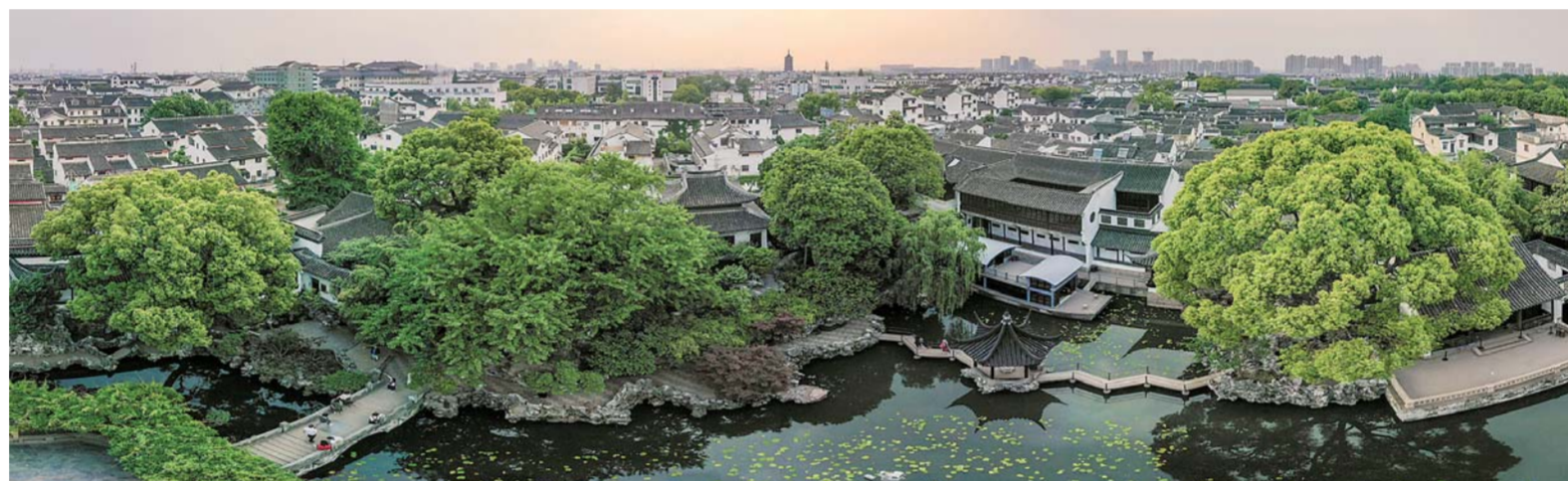
左上图:这是6月2日,工作人员在北京世园会江苏园表演;右上图:这是5月9日无人机拍摄的江苏苏州拙政园;下图:这是5月9日无人机拍摄的江苏苏州狮子林。