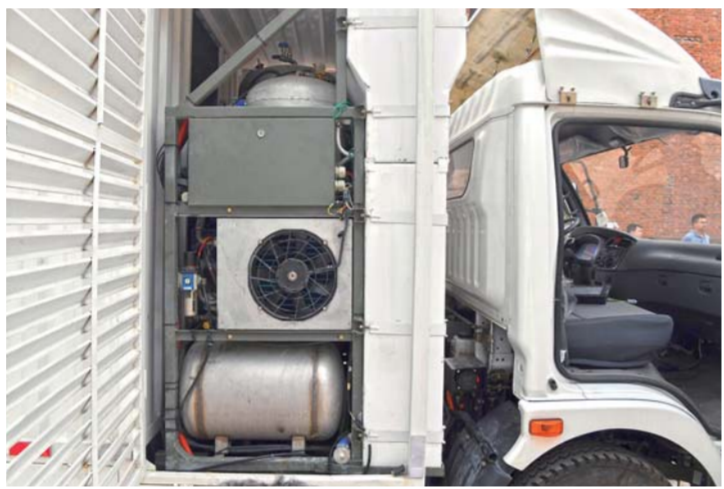
▲在南阳洛特斯新能源汽车有限公司厂区展示的“水氢发动机车”(5月25日摄)。