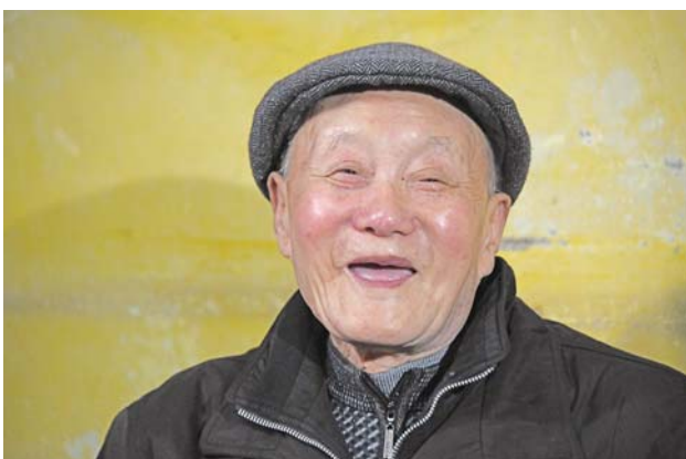
▲这是3月31日拍摄的张富清。