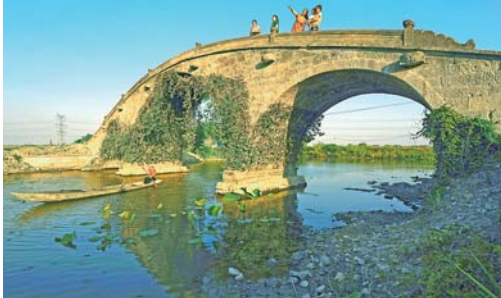
浙江南浔：明代种德桥重现真容

浙江湖州南浔区的种德桥始建于明天顺元年。近日，有关单位对种德桥实施修缮，古桥重现500多年前的风貌。