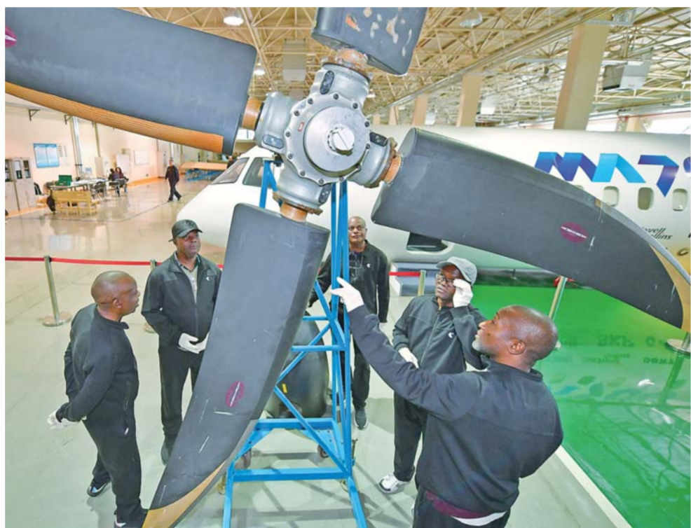
▲4月16日,在西飞民航客户服务中心维修实训车间内,安哥拉学员查看飞机螺旋桨的机械结构。

天时间,整个旅途几乎都是在40至50摄氏度的沙漠戈壁中穿行。2017年1月28日,新舟60飞机正式在厄立特里亚投入商业运行,2天的车程用1个小时的航程就完成了。”西飞民航