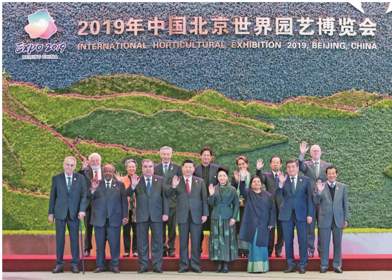
▲ 这是开幕式前, 习近平和夫人彭丽媛同参加开幕式的外方领导人集体合影。