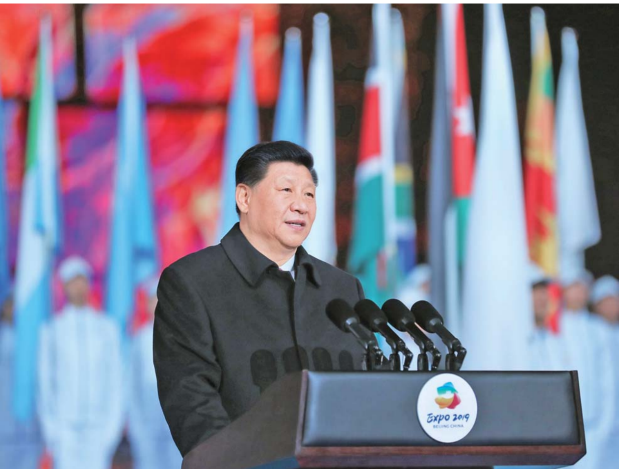
▲ 4 月 28 日, 国家主席习近平在北京延庆出席 2019 年中国北京世界园艺博览会开幕式, 并发表题为《共谋绿色生活, 共建美丽家园》的重要讲话。