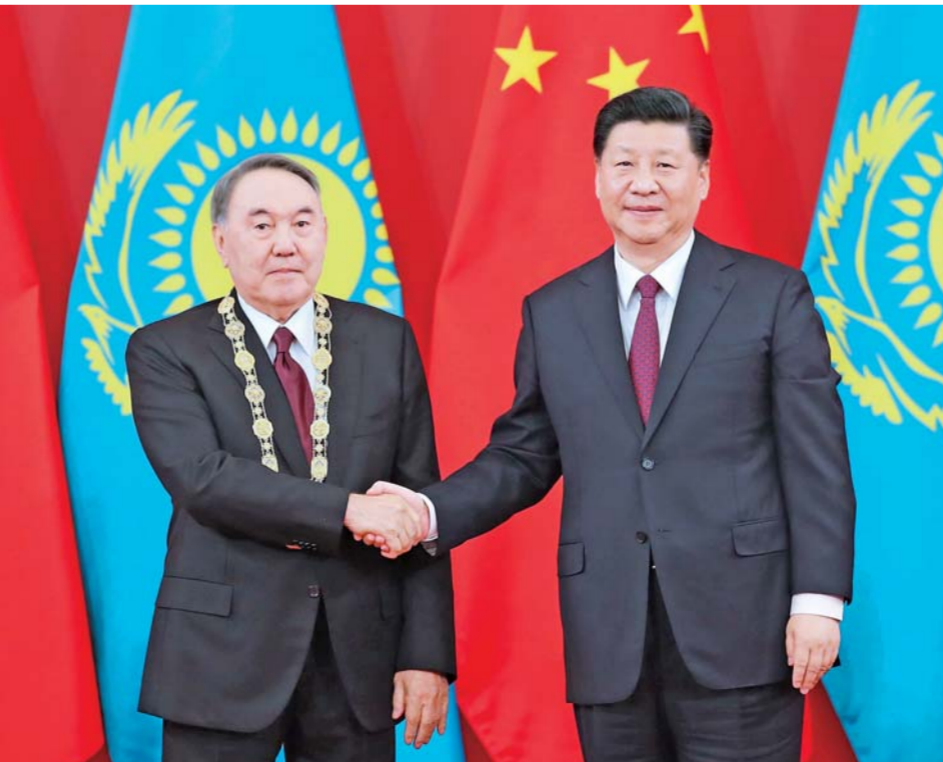
▲ 4 月 28 日, 国家主席习近平在北京人民大会堂中央大厅为哈萨克斯坦首任总统纳扎尔巴耶夫举行“友谊勋章”颁授仪式。

新华社北京 4 月 28 日电(记者白洁) 国家主席习近平 28 日在人民大会堂会见哈萨克斯坦首任总统纳扎尔巴耶夫。 习近平强调, 纳扎尔巴耶夫先生是哈萨克斯坦的开国元首和民族领袖, 为哈萨克斯坦国家独立和发展建立了不朽功勋, 为哈萨克斯坦民族立功、立言、立德, 也为中哈全面战略伙伴关系的发展和建立作出了历史性贡献, 我们对此高度评价。中哈关系已走过 27 年, 经受住了历史考验, 展现出强大生命力。中方坚定支持哈萨克斯坦独立、主权、领土完整、社会稳定、经济发展。 习近平强调, 中哈是共建“一带一路”的先行者。双方要再接再厉, 深化发展战略对接, 落实好丝绸之路经济带建设同“光明之路”新经济政策对接合作规划。要促进贸易和投资便利化, 稳步推进产能合作, 加强互联互通建设。要密切人文交流, 扩大地方合作, 提升安全合作水平, 继续在国际事务中保持密切合作。我期待着同托卡耶夫总统建立密切的工作关系和友谊, 共同推动中哈关系取得新进展。 纳扎尔巴耶夫表示, 这是我同我的好朋友、老朋友习近平主席第 19 次会面, 我永远珍藏这份深厚的友谊。伟大的中国是哈萨克斯坦高度信赖的好伙伴。衷心祝贺中华人民共和国成立 70 周年, 世界上没有哪个国家在如此短的时间内取得如此巨大的成就。中国的发展、中国的担当对世界和全人类意义重大。我卸任后, 哈萨克斯坦内外政策将保持连贯稳定, 哈方将继续坚定致力于推动中哈全面战略伙伴关系不断向前发展。祝贺中方成功举办第二届“一带一路”国际合作高峰论坛。哈萨克斯坦的“光明之路”倡议已成为“一带一路”合作重要组成部分。哈方愿同中方深化“一带一路”框架内合作。哈方支持中国在国际事务中的重要主张, 支持共同打击“三股势力”。 丁薛祥、杨洁篪、王毅、何立峰参加会见。 新华社北京 4 月 28 日电(记者白洁、马岩) 国家主席习近平 28 日在人民大会堂中央大厅为哈萨克斯坦首任总统纳扎尔巴耶夫举行“友谊勋章”颁授仪式。 中共中央政治局常委、中央书记处书记、党和国家功勋荣誉表彰工作委员会主任王沪宁出席颁授仪式。 宏伟的中央大厅气氛庄严、隆重、热烈, 中国、哈萨克斯坦两国国旗整齐排列。巨幅红色背景板上以中、哈文书写着“中华人民共和国 友谊勋章”字样, 金色的“友谊勋章”图案在灯光照耀下熠熠生辉。 仪式开始, 中国人民解放军仪仗队礼兵正步登上授勋台, 分列两侧。