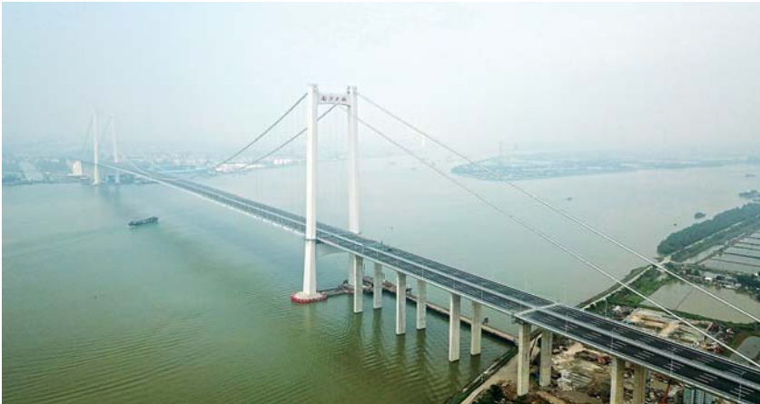
▲4月2日,作为粤港澳大湾区内又一条重要过江通道的南沙大桥正式通车。南沙大桥全长12.89公里,双向八车道,设计行车速度为100公里每小时,开通后可极大缓解珠江口东西两岸的交通压力(详细报道见3版)。