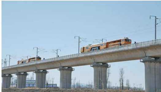
张呼高铁预计年内开通 目前,张(家口)呼(和浩特)高铁在加紧建设,为即将到来的静态验收做准备,预计年内开通运营(4月2日摄)。