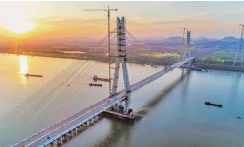
池州长江公路大桥合龙 4月2日,安徽池州长江公路大桥顺利合龙,大桥建设进入桥面铺装施工阶段(4月1日无人机拍摄)。