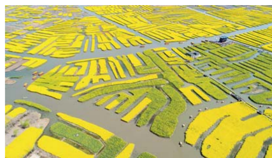
江苏泰州：千垛菜花引客来

近日，江苏省兴化市千垛菜花景区的油菜花次第盛开，吸引了众多游客前往赏花游玩（无人机拍摄，3月31日摄）。