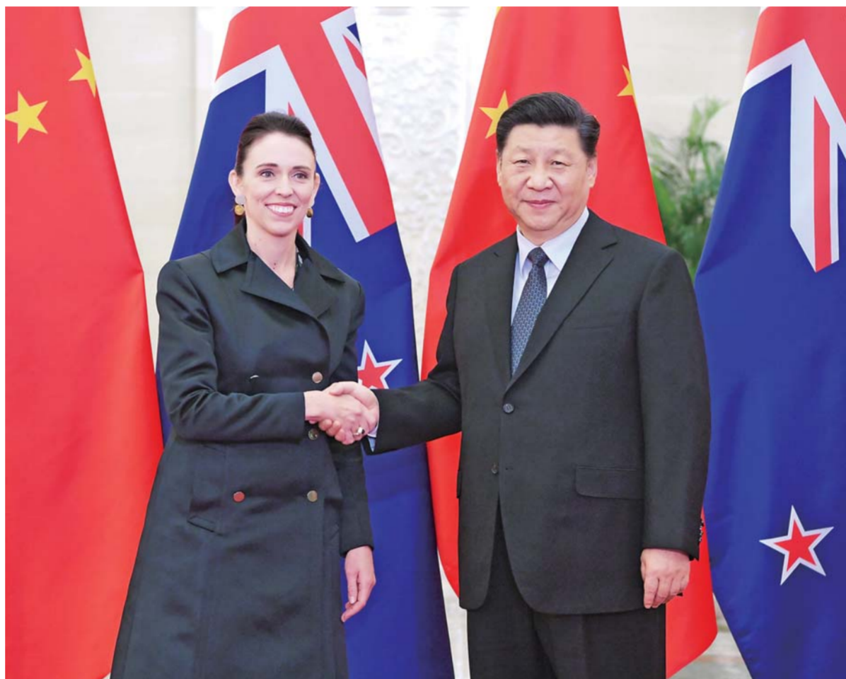
新华社北京4月1日电（记者白洁）国家主席习近平1日在人民大会堂会见新西兰总理阿德恩。