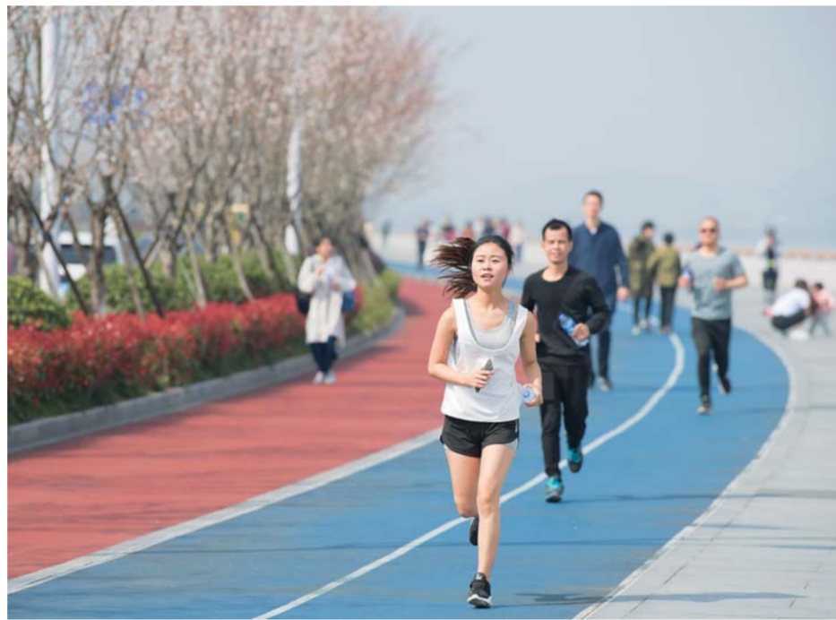
▲人们在樱花大道参加“樱花跑”(2018年3月24日摄)。