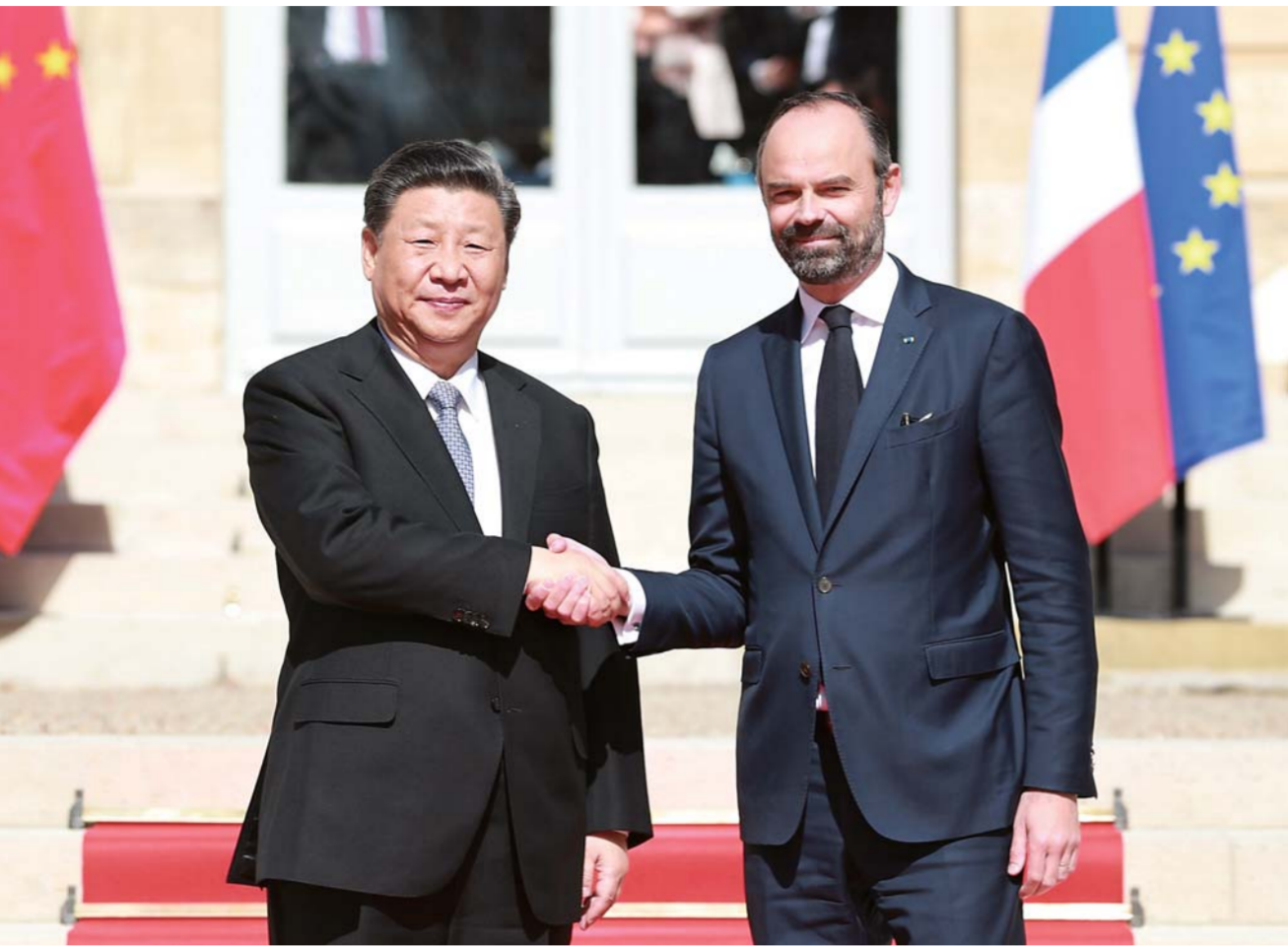
▲ 3月26日，国家主席习近平在巴黎总理府会见法国总理菲利普。