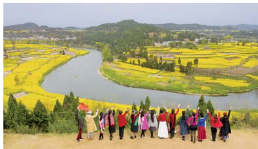
四川：乡村振兴花为媒

3月21日，游客在德阳市罗江区蟠龙镇文昌村留影。四川各地以花为媒，做强美丽经济，助力乡村振兴。