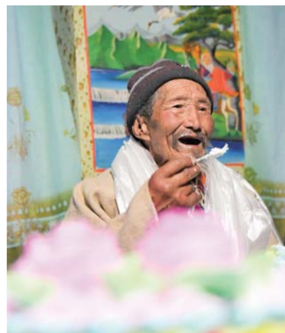
▲巴珠老人在吃生日蛋糕。