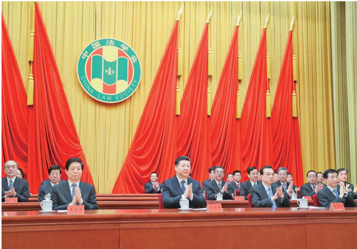
▲3月19日，中国法学会第八次全国会员代表大会在北京人民大会堂开幕。习近平、李克强、栗战书、王沪宁等党和国家领导人到会祝贺。