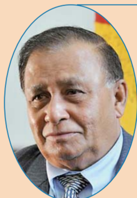
斯里兰卡驻华大使 科迪图瓦库

中国经济的发展促进了全球经济增长，中国在经贸和国际关系方面的政策对世界举足轻重。