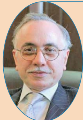
巴基斯坦驻华大使 马苏德·哈立德

中国脱贫事业的发展同样令人难以置信。我相信，世界上没有一个国家能够在40年间让7亿多人口摆脱贫困，中国政府和人民携手创造了这一奇迹。