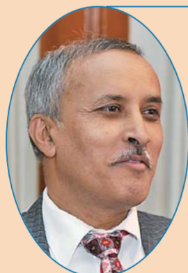
尼泊尔驻华大使 利拉·马尼·鲍德尔

新中国成立70年来取得了非凡成就，极其鼓舞人心。中国经验表明，只要国家有决心，牢记人民利益高于一切，就一定会获得成功。