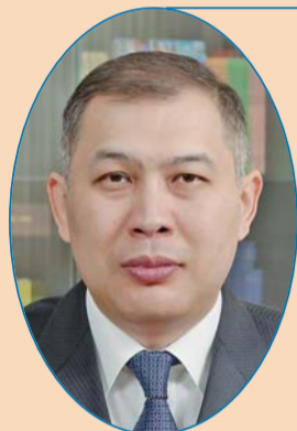
沙特阿拉伯驻华大使 沙赫拉特·努雷舍夫

在过去70年，中国取得了令人瞩目的非凡成就。我们相信，中国经济能在世界经济动荡背景下保持稳定发展，拥有广阔的发展潜力。