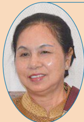
老挝驻华大使 万迪·布达萨冯

这（“一带一路”倡议）是一个具有远见卓识的倡议，既包含了共同利益，也反映了各方诉求，充分表达了中国与世界各国携手共建人类美好未来的决心。