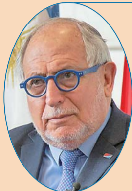
阿根廷驻华大使 盖铁戈

中国两会牵动世界目光。今年两会召开期间，16位外国驻华大使接受了新华网专访，就脱贫攻坚、经济发展、改革开放等两会上的热点议题，发表了他们的看法。以下是摘录的访谈精彩内容，以飨读者。