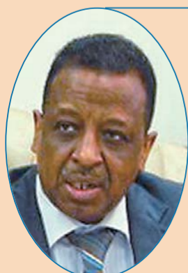
苏丹驻华大使 艾哈迈德·沙维尔

中国在消除贫困和支持贫困地区发展方面取得了巨大的成就，消除贫困的经验是中国最重要的发展经验之一。