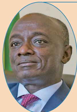
加纳驻华大使 爱德华·博阿滕

在过去70年，中国取得了令人瞩目的非凡成就。我们相信，中国经济能在世界经济动荡背景下保持稳定发展，拥有广阔的发展潜力。