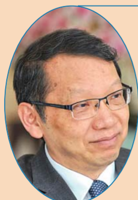
泰国驻华大使 毕力亚·针蓬

中国在消除贫困和支持贫困地区发展方面取得了巨大的成就，消除贫困的经验是中国最重要的发展经验之一。