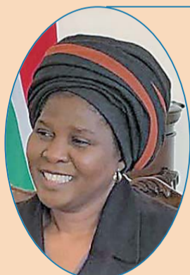
南非驻华大使 多拉娜·姆西曼

这（“一带一路”倡议）是一个具有远见卓识的倡议，既包含了共同利益，也反映了各方诉求，充分表达了中国与世界各国携手共建人类美好未来的决心。