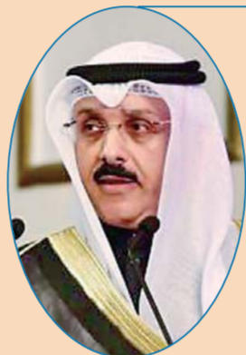
科威特驻华大使 赛米赫·焦哈尔·哈亚特

在短短40年时间里，中国加速了工业化进程，解决了7亿多农村人口的贫困问题，是一个令所有人惊叹的“中国奇迹”。我常想，怎样才能创造“加纳奇迹”？