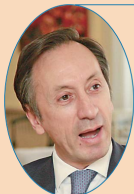
葡萄牙驻华大使 杜傲杰

中国在发展自身的同时，还会助力其他国家共同进步。对包括尼泊尔在内的发展中国家来说，中国持续发展，意味着我们将拥有更多发展机遇。