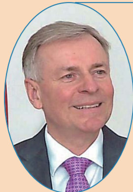
奥地利驻华大使 石迪福

中国脱贫事业的发展同样令人难以置信。我相信，世界上没有一个国家能够在40年间让7亿多人口摆脱贫困，中国政府和人民携手创造了这一奇迹。