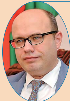
白俄罗斯驻华大使 鲁德·基里尔

短短几年内，中巴经济走廊已成为“一带一路”框架下规模最大、成果最显著、最成功的工程之一。该项目已直接给巴基斯坦创造了近7万个就业机会。