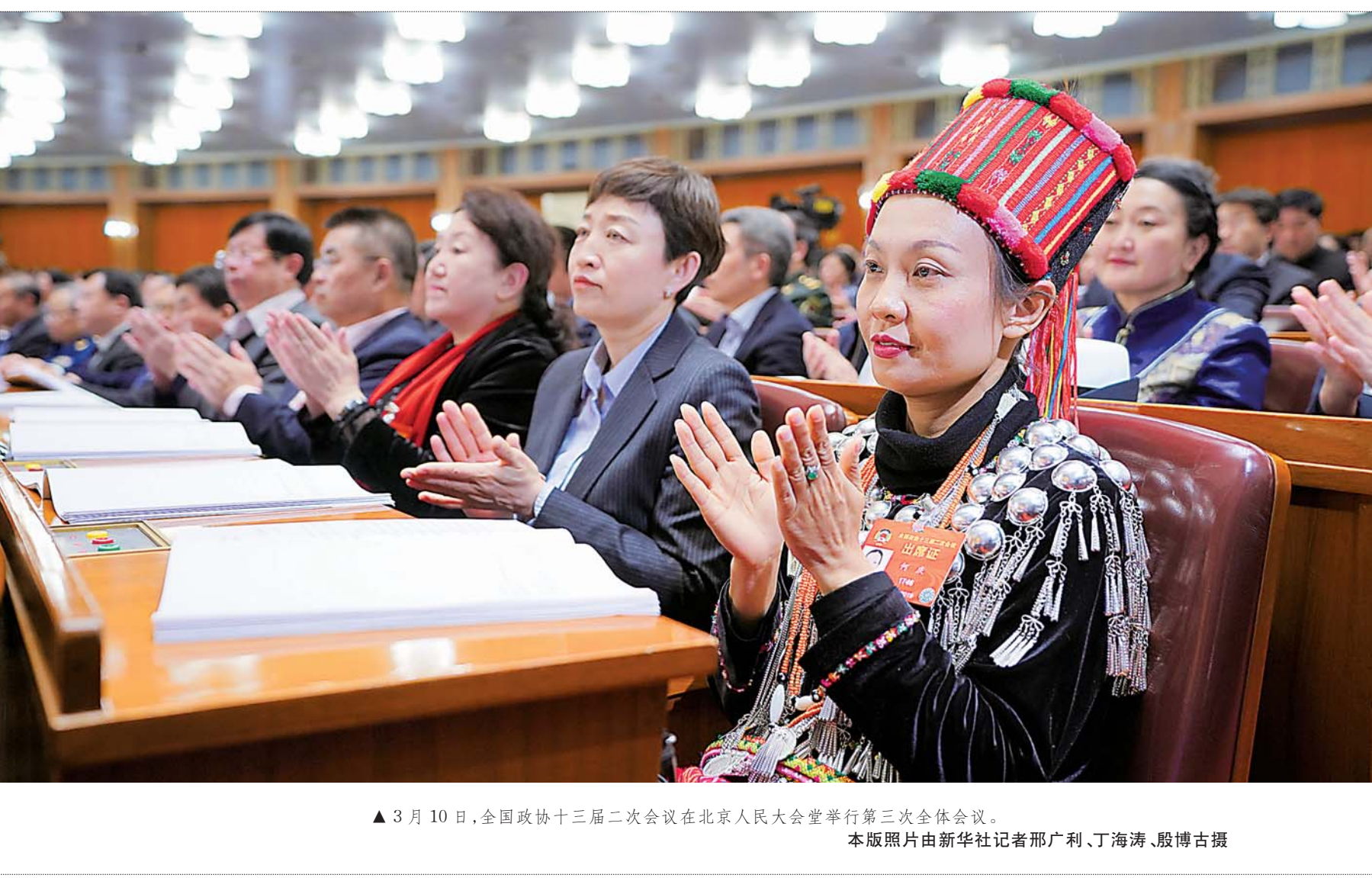
▲3月10日，全国政协十三届二次会议在北京人民大会堂举行第三次全体会议。

据新华社北京3月10日电(记者张旭东、林晖、刘慧)全国政协十三届二次会议10日下午在人民大会堂举行第三次全体会议... 会议由郑建邦主持。会议执行主席是刘奇葆、万钢、马飏、陈晓光、李斌、何立峰、郑建邦、邵琦。全国政协副主席张庆黎、董建华、何厚铨、卢展工、王正伟、梁振英、夏宝龙、杨传堂、巴特尔、汪水清、苏辉、滕彪、刘新成、何维、高云龙出席会议。