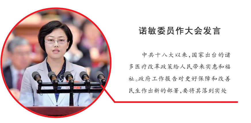
诺敏委员作大会发言

中共十八大以来，国家出台的诸多医疗改革政策给人民带来实惠和福祉。政府工作报告对更好保障和改善民生作出的部署，要将其落到实处... 二是推进机构养老服务标准化。注重医养结合，建立养老机构服务质量和评价标准体系，养老机构向规模化、专门化发展，满足不同群体特别是高龄、独居、失能、失智老年人的需求。