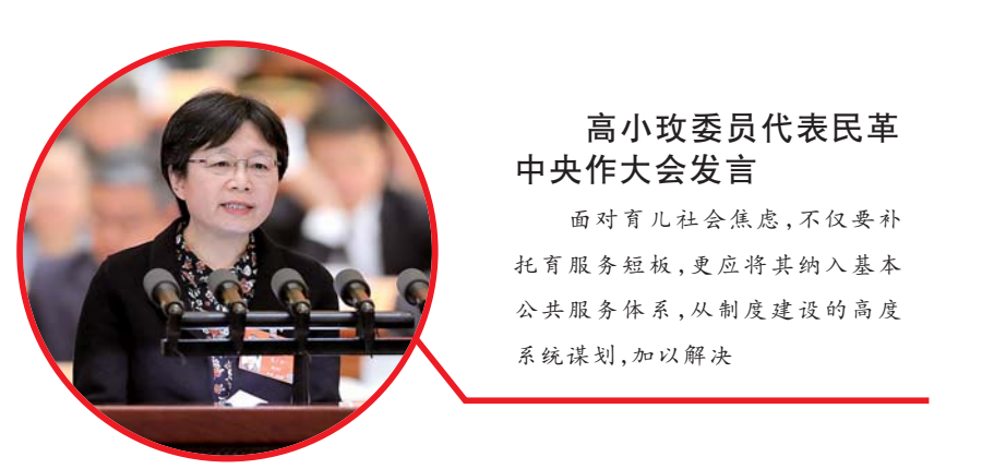
高小玫委员代表民革中央作大会发言

面对有几亿儿童焦虑，不仅要补充托育服务短板，更应将其纳入基本公共服务体系，从制度建设的高度系统谋划，加以解决... 高小玫委员代表民革中央作大会发言。面对有几亿儿童焦虑，不仅要补充托育服务短板，更应将其纳入基本公共服务体系，从制度建设的高度系统谋划，加以解决。