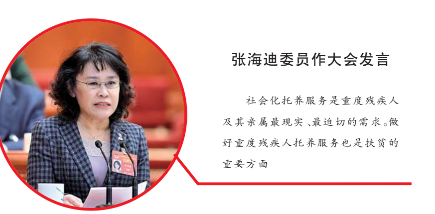
张海迪委员作大会发言

社会化托养服务是重度残疾人及其亲属最现实、最迫切的需求... 张海迪委员作大会发言。社会化托养服务是重度残疾人及其亲属最现实、最迫切的需求。