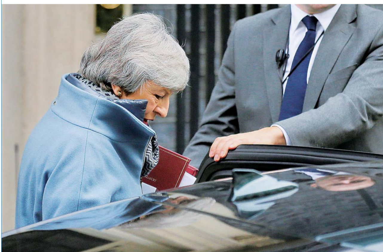
▲2月13日，在英国伦敦，英国首相特雷莎·梅离开唐宁街10号首相府，前往议会进行首相问答。