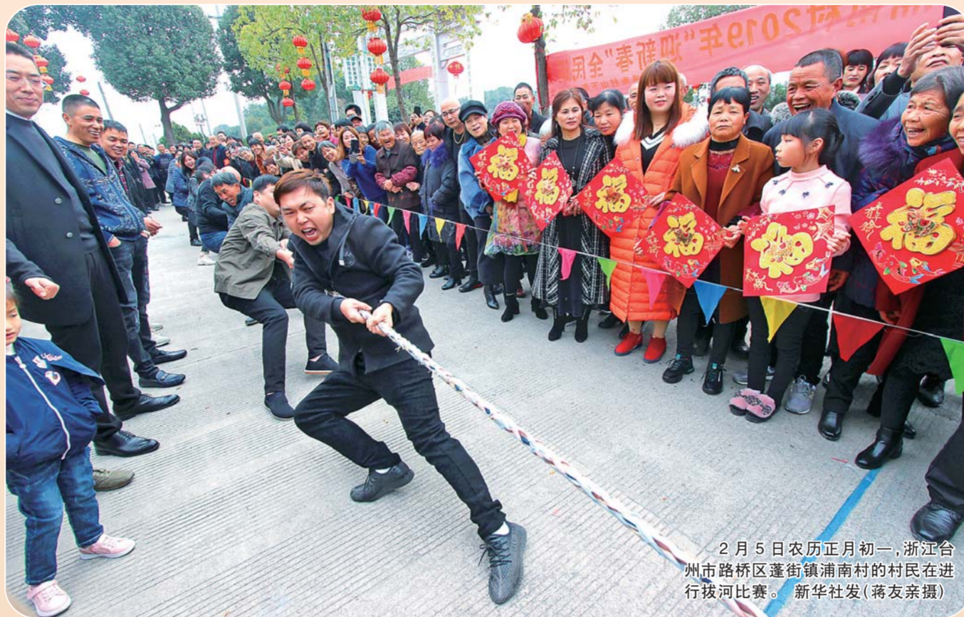
2月5日农历正月初一，浙江台州市路桥区蓬街镇南村的村民在进行拔河比赛。