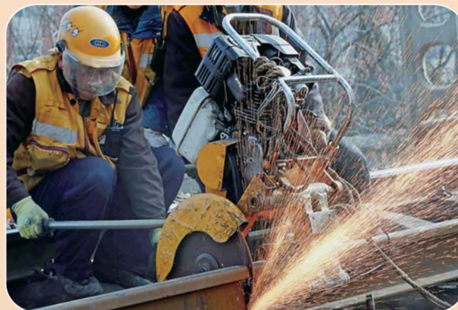
▲2月5日，中国铁路郑州局集团有限公司郑州桥工段对陇海铁路郑州站北“咽喉”区一段85米长的钢轨进行更换作业。