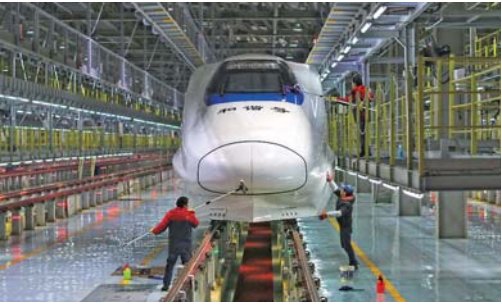
夜间检车备战春运 春运临近,贵阳北动车运用所300余名员工值守夜间,对配属的动车组进行检修维护。