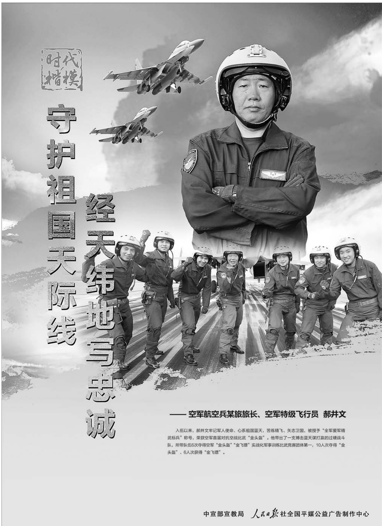
——空军航空兵某旅旅长、空军特级飞行员 郝井文

“寒门何以能出贵子，很多时候就是靠关键时刻有人拉一把。一个都不能少我做不到，我所能做的就是拉住一个是一个。”陈立群说。