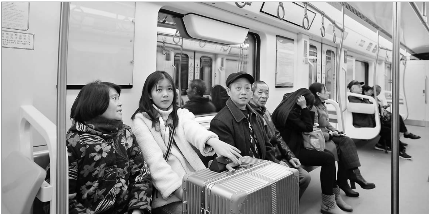
▲12月28日,乘客乘坐重庆轨道交通环线东北半环列车。当日,重庆轨道交通环线东北半环开通试运营。东北半环线途经重庆图书馆等17站,全长33.7公里。

全国人大财政经济委员会认为,在当前经济运行稳中有变、经济下行压力加大的情况下,国务院向全国人大常委会提出授权议案,有利于地方政府及时落实项目安排,及早发挥政府债券资金对稳投资、扩内需、补短板的重要作用,有利于保持经济持续健康发展,是必要的、可行的。