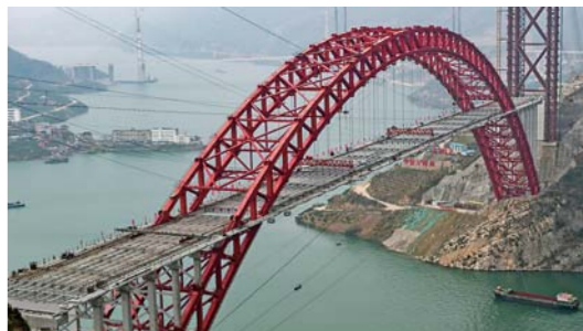
香溪长江大桥合龙

12月27日,位于湖北宜昌的香溪长江公路大桥主桥顺利合龙,标志着大桥开始进入桥面铺装施工阶段。