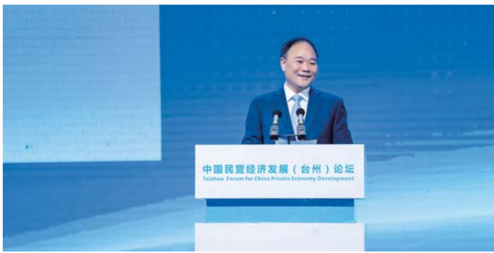
李书福在中国民营经济论坛(台州)论坛上发表演讲(11月30日摄)。

据新华社杭州12月21日电(记者王俊祿)从小作坊起步,他带领吉利汽车从小到大,由弱变强,从小山村走向全世界。回望40年,民营经济开放发展的优秀代表、浙江吉利控股集团董事长李书福认为,吉利的发展应归功于改革开放的好政策,必须倍加珍惜,为“中国汽车跑遍全世界”而顽强拼搏。