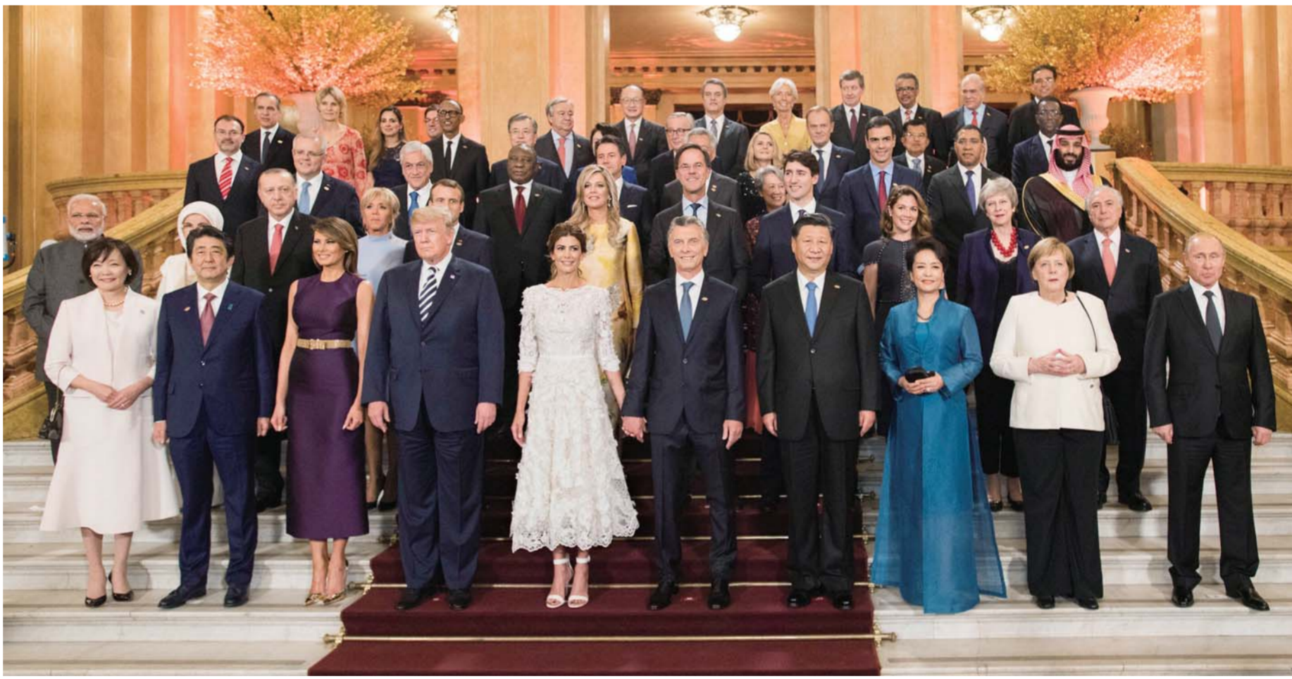
当地时间十一月三十日,二十国集团领导人第十三次峰会在阿根廷布宜诺斯艾利斯举行。当晚,国家主席习近平和夫人彭丽媛同出席峰会的各代表团团长夫妇集体合影。