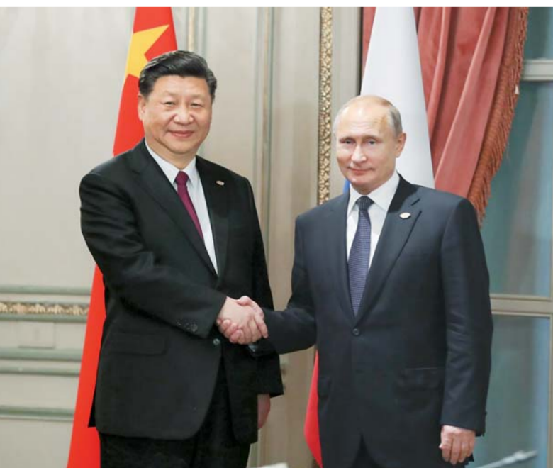
当地时间十一月三十日,国家主席习近平在布宜诺斯艾利斯会见俄罗斯总统普京。