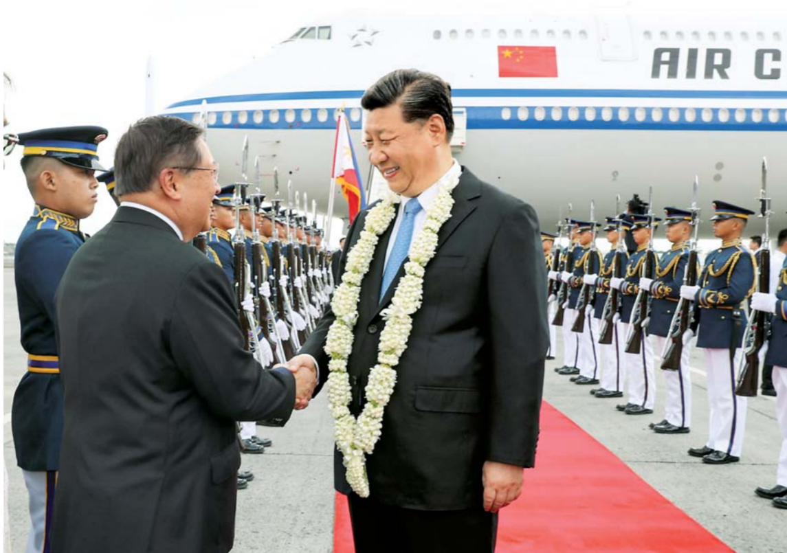
▲11月20日，国家主席习近平抵达马尼拉，开始对菲律宾共和国进行国事访问。这是习近平在机场受到菲律宾政府高级官员热情迎接。