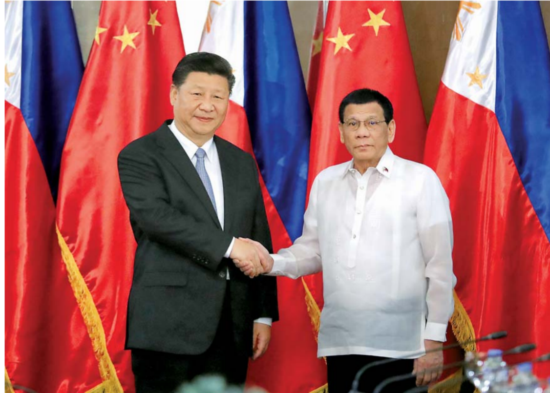
▲11月20日，国家主席习近平在菲律宾总统府同菲律宾总统杜特尔特举行会谈。