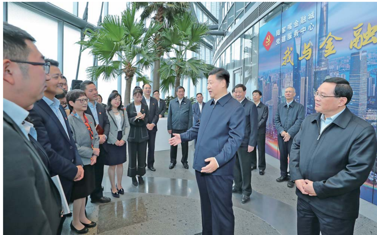
▲11月6日至7日,中共中央总书记、国家主席、中央军委主席习近平在上海考察。这是6日上午,习近平在上海中心大厦22层的陆家嘴金融城党建服务中心,同正在联合开展主题党日活动的企业党员亲切交谈。

新华社上海11月7日电中共中央总书记、国家主席、中央军委主席习近平近日在上海考察时强调,坚持以新时代中国特色社会主义思想为指导,坚决贯彻落实党中央决策部署,坚定改革开放再出发的信心和决心,坚持稳中求进工作总基调,全面贯彻新发展理念,坚持以供给侧结构性改革为主线,加快建设现代化经济体系,打好三大攻坚战,加快提升城市能级和核心竞争力,更好为全国改革发展大局服务。