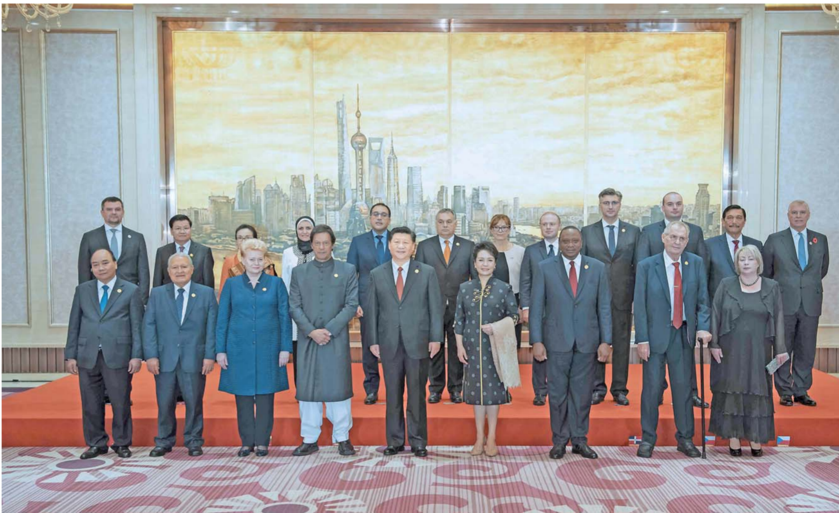
▲11月4日晚,国家主席习近平和夫人彭丽媛在上海举行宴会,欢迎出席首届中国国际进口博览会的各国贵宾。这是宴会前,习近平和彭丽媛同各国领导人夫妇合影留念。

新华社上海11月4日电(记者季明、刘华)国家主席习近平和夫人彭丽媛4日晚在上海举行宴会,欢迎出席首届中国国际进口博览会的各国贵宾。