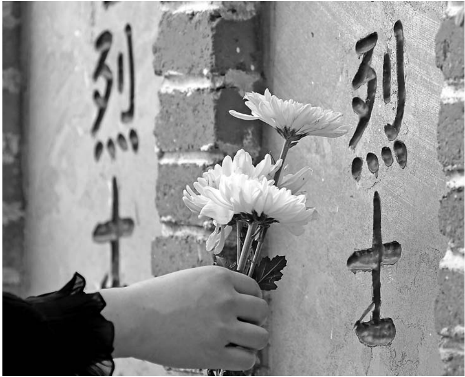
▲9月30日,市民在山东省枣庄革命烈士陵园向无名烈士墓碑献花。

红缎鲜花,青松翠柏。英烈荣光,民族脊梁!9月30日,以国家的名义,从首都北京的人民英雄纪念碑到遍布祖国各地的烈士纪念场所,从党和国家领导人到各族各界群众,身处神州大地各处的中华儿女怀着共同的心情,致敬英烈、缅怀英烈、传诵英烈。