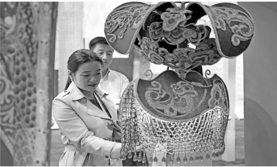
日前,在敦煌国际会展中心,参观者欣赏展出的艺术品。

本届文博会上,还展览了乌克兰、巴勒斯坦、土耳其、以色列等超过60个国家的艺术作品,展现了“一带一路”沿线国家的艺术风貌。