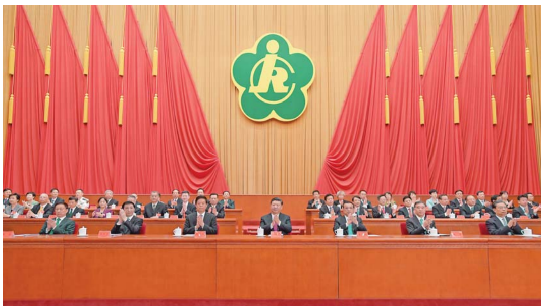
▲9月14日，中国残疾人联合会第七次全国代表大会在北京人民大会堂开幕。习近平、李克强、栗战书、汪洋、王沪宁、赵乐际、韩正等在主席台就座，祝贺大会召开。