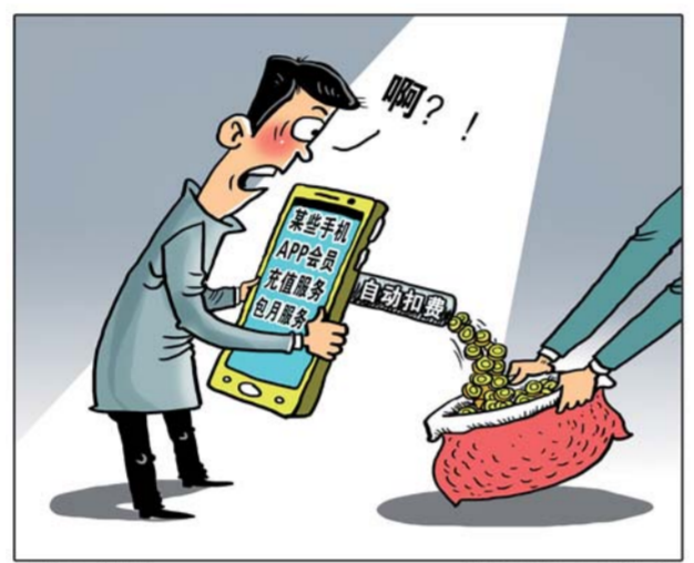
“自动续费” 朱慧卿 作

套路一：“免费试用”不免费。苹果应用商店中一款拍照APP,在首页打着“解锁更高级功能——点击免费试用”的幌子,用户点击进去却被要求开通包月服务。原来,所谓的“免费试用”是先购买每月的包月服务,然后才能获得赠送的“7天免费”会员服务。