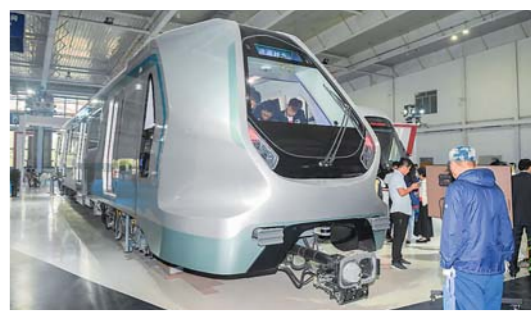
新一代智能地铁列车亮相

正在举办的长春轨道交通展上，中车长春轨道客车股份有限公司发布新一代地铁列车。该车能实现全自动无人运行。