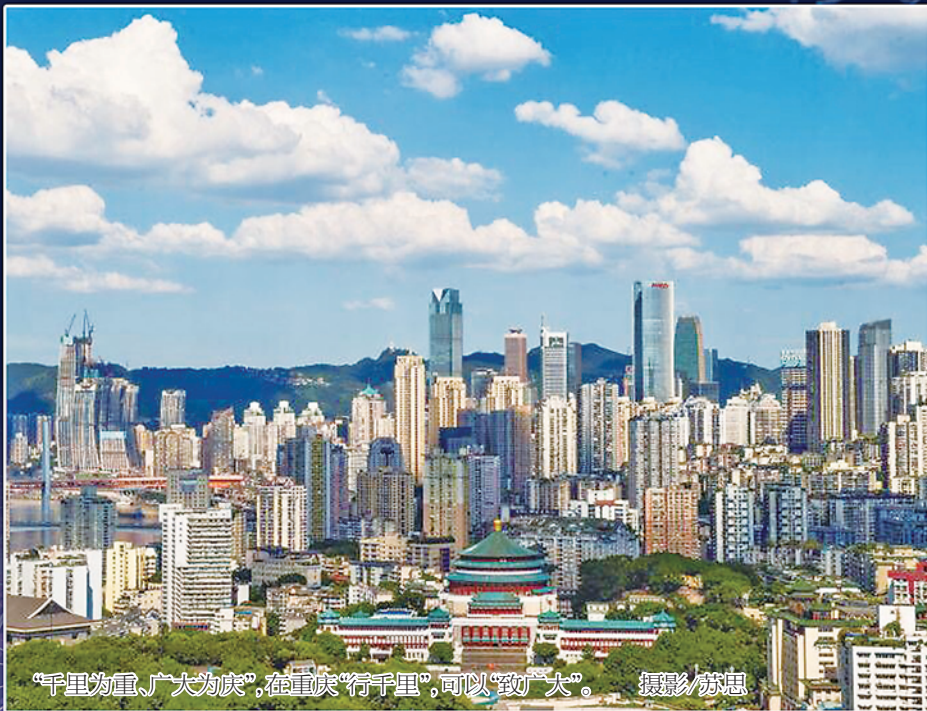
“千里为重、广大为庆”,在重庆“行千里”,可以“致广大”。

“系列活动”即系列主题会议、高端论坛、专业峰会、系列发布活动、项目集中签约等。系列主题会议、高端论坛、专业峰会和智能化应用活动,拟联合相关国家部委、研究机构、行业协会和知名企业等,举行数字经济百人会和智能生活·创新未来重庆国际友好城市市长圆桌会两场主题会议,新加坡-重庆数字经济高端论坛暨企业对接会、半导体产业、人工智能、智能制造、5G与未来网络、工业互联网、智能超算、智能化应用与高品质生活(含智能农业、智能物流、智慧医疗、智慧交通、大数据共享与应用等)、智能时代信息安全等9场高端论坛,腾讯云+未来重庆峰会、智能时代车联网发展论坛、2018云栖大会·重庆峰会、钉峰会、华为云中国行2018、“AI赋能·智享未来”科大讯飞AI+技术创新发展论坛、区块链创新发展论坛等7场专业峰会。系列发布活动,包含首届智博会会议成果发布,有关国家成果专场发布,国际友好城市推介活动,《中国智能化发展指数报告》、《中国大数据发展指数报告》发布,重庆市《以大数据智能化为引领的创新驱动发展行动计划》和集成电路、工业互联网等政策发布,两江新区未来智慧生活体验馆规划和有关区县、市级有关部门贯彻落实《以大数据智能化为引领的创新驱动发展行动计划》推介发布,有关兄弟省市区及大企业发布活动等7个方面内容。