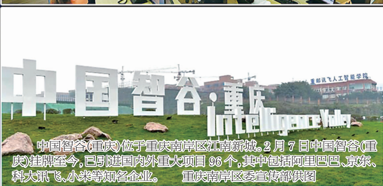
中国智谷(重庆)位于重庆南岸区江南新城。2月7日中国智谷(重庆)挂牌至今,已引进国内外重大项目96个,其中包括阿里巴巴、京东、科大讯飞、小米等知名企业。