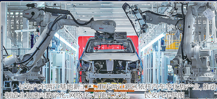
长安汽车两江基地新工厂,重庆两江新区依托汽车等优势产业,推动制造业加速向数字化、网络化、智能化发展。