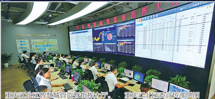
重庆江北区智慧城管监督指挥大厅。