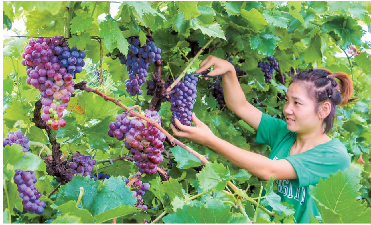
▲8月14日,在河北永清县三圣口乡冰窖村,游客在采摘葡萄。河北省永清县三圣口乡冰窖村是该县有名的葡萄种植专业村。近年来,该村大力推广引进葡萄种植新技术、新品种,引导农民种植错季葡萄,实现了每年4月至9月都有不同品种的葡萄上市,目前全村种植葡萄5000余亩,年产值达3000余万元。