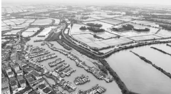
▲这是在广东江门市横山渔港避风的渔船(8月14日无人机拍摄)。

如今,办事大厅里排队的现象少了,咨询如何上网办理的热线电话多了,越来越多办事群众开始体验“最多跑一次”甚至“不见面”审批服务带来的方便快捷。截至今年6月底,宁夏全区80.4%的政务服务事项实现“不见面”办理。