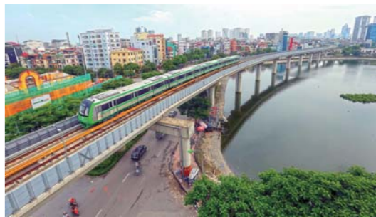
中企承建越首条城轨具备运行条件

由中铁六局集团有限公司总承包建设的越南首条城市轨道交通日前成功完成正线送电和热滑测试，标志着该项目正式具备运行条件。