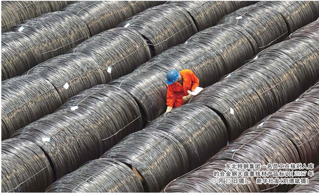
东北特钢集团一名员工在核对入厂的合金钢大线产品标识(2017年5月15日摄)。

一年后，1986年8月3日，沈阳市政府再次举行新闻发布会，郑重宣布：沈阳市防爆器械厂于1985年8月3日被正