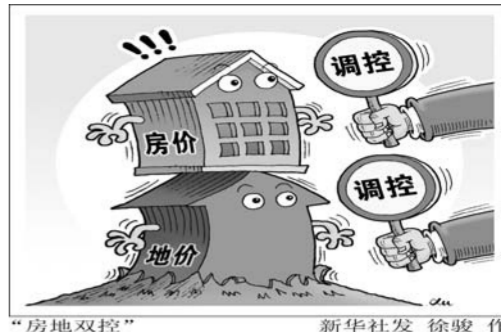
“房地双控” 新华社发 徐骏作

福建省国资委党委书记、主任邵玉龙表示,福建省国有企业将以整合重组为契机,解决部分企业主业不突出、专业化经营不专、市场竞争力不强的问题,确保到2020年,将省属企业80%以上资产布局在主导产业、战略性新兴产业、高端服务业、基础设施等关键领域。