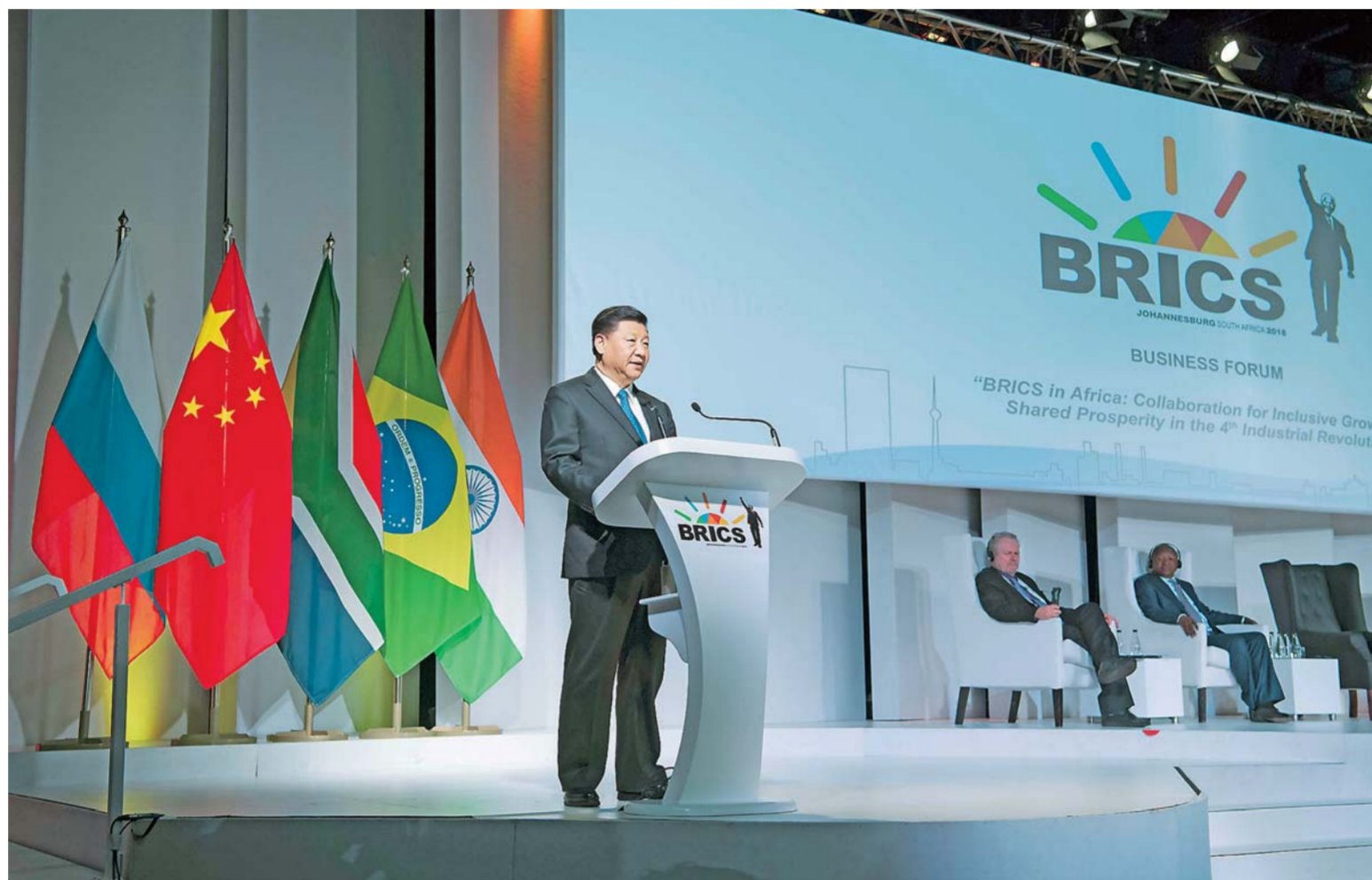
▲7月25日,国家主席习近平应邀出席在南非约翰内斯堡举行的金砖国家工商论坛,并发表题为《顺应时代潮流 实现共同发展》的重要讲话。

习近平指出,金砖机制的诞生和发展,是世界经济变迁和国际格局演变的产物。在第一个10年里,金砖合作乘势而起,为世界经济企稳复苏并重回增长之路作出了突出贡献。当今世界正面临百年未有之大变局。对广大新兴市场国家和发展中国家而言,这个世界既充满机遇,也存在挑战。我们要在国际格局演变的历史进程中运筹金砖合作,在世界发展和金砖国家共同发展的历史进程中谋求自身发展,在第二个“金色十年”里实现新的飞跃。