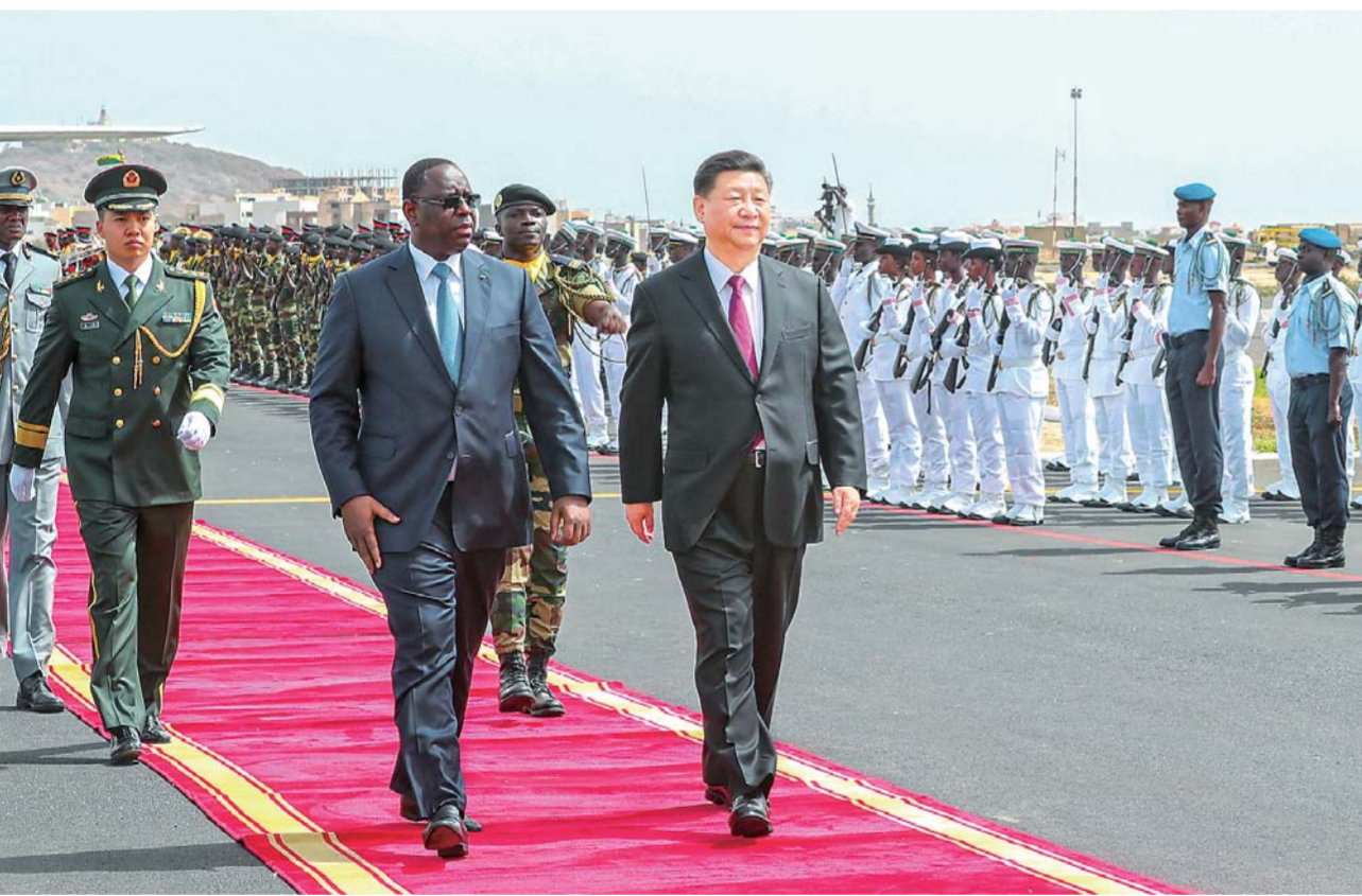
▲7月21日，国家主席习近平抵达达喀尔，开始对塞内加尔共和国进行国事访问。塞内加尔总统萨勒在机场为习近平举行隆重欢迎仪式。这是习近平在萨勒陪同下检阅仪仗队。