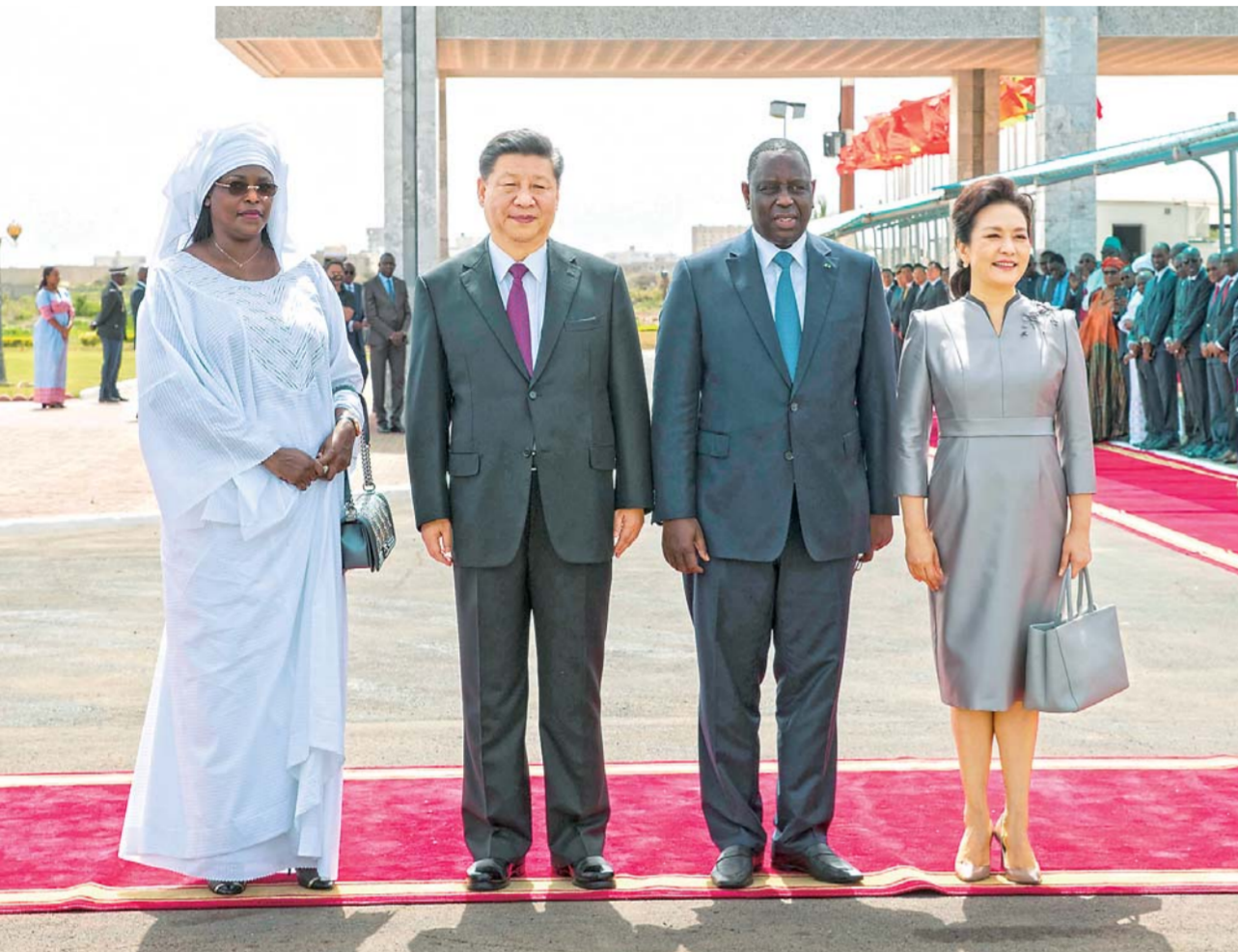
▲7月21日，国家主席习近平抵达达喀尔，开始对塞内加尔共和国进行国事访问。塞内加尔总统萨勒在机场为习近平举行隆重欢迎仪式。习近平在萨勒陪同下检阅仪仗队。这是检阅后，习近平主席和夫人彭丽媛同萨勒总统和夫人玛丽梅合影留念。