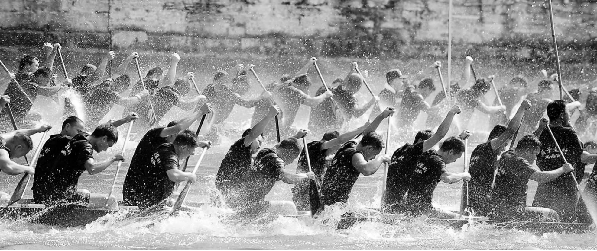
▲6月18日,在贵州省黔东南苗族侗族自治州镇远县,当地群众在传统龙舟赛上赛龙舟。