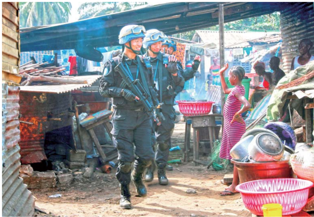
▲2018年2月7日,在利比里亚首都蒙罗维亚,中国维和警察防暴队在当地社区开展徒步武装巡逻勤务。

目前,中国已成为联合国五个常任理事国中派出维和部队最多的国家,中国军队先后参加了24项联合国维和行动,新建、修复道路1.4万余公里,排除地雷及各类未爆炸物9800余枚,接诊