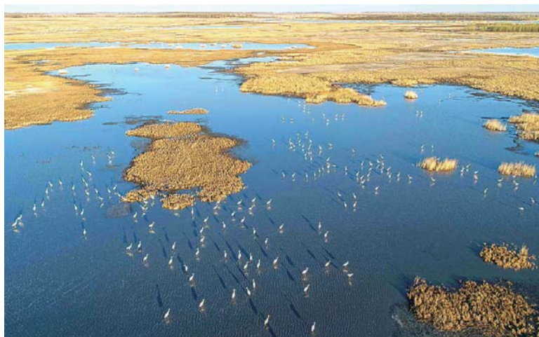
▲这是在莫莫格湿地白鹤栖息的画面（4月29日无人机拍摄）。