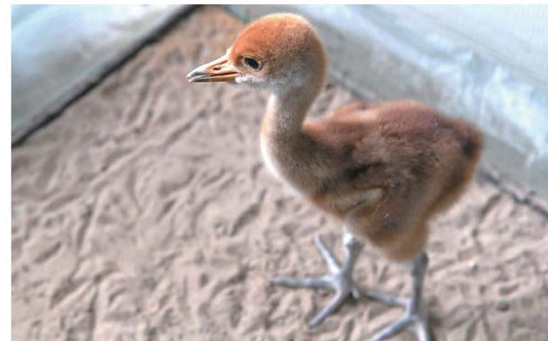
▲莫莫格国家级自然保护区人工繁育区里一只出壳11天的丹顶鹤宝宝(4月29日摄)。