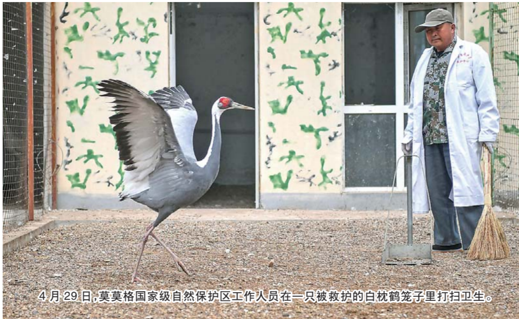
4月29日,莫莫格国家级自然保护区工作人员在一只被救护的白枕鹤笼子里打扫卫生。