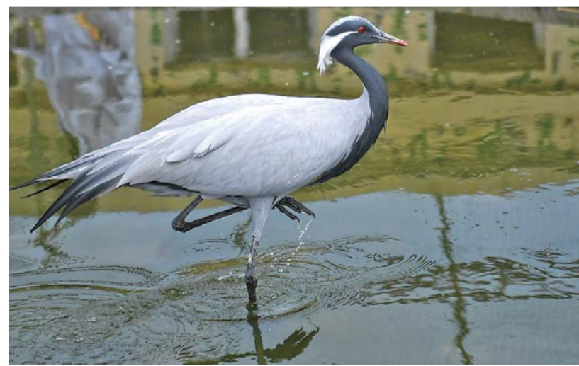
▲4月29日,莫莫格国家级自然保护区里一只被救护的蓑羽鹤在栖息。