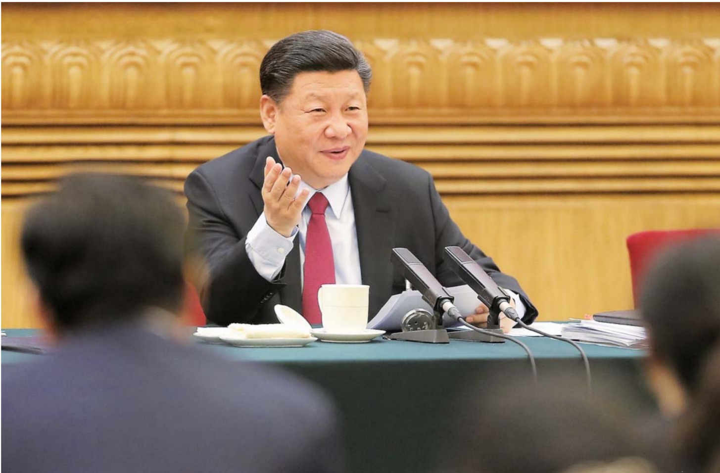
▲3月8日,中共中央总书记、国家主席、中央军委主席习近平参加十三届全国人大一次会议山东代表团的审议。