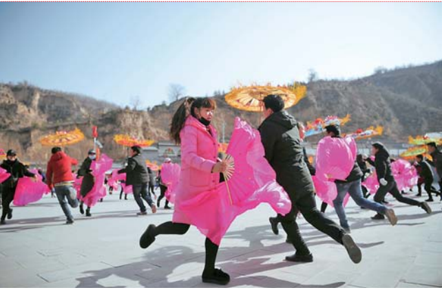
▲2月8日，陕西延川文安驿镇梁家河村村民在排练秧歌。