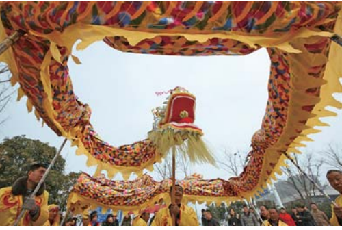
红红火火过大年 2月16日，在安徽蒙城县鲲鹏湖公园广场，农民舞龙队准备舞龙。