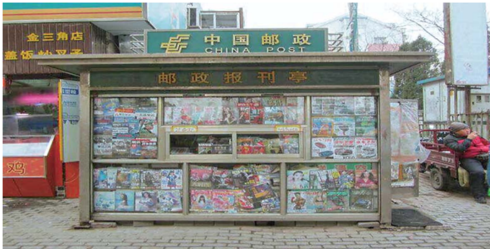
▲图为大连街头的报刊亭。