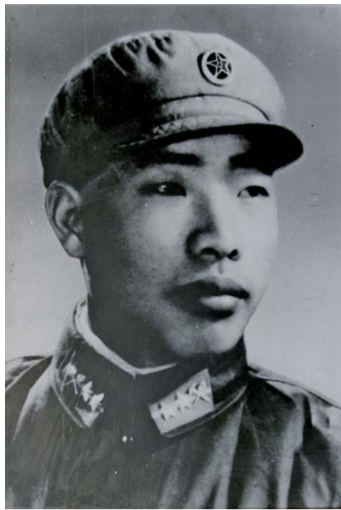
▲王杰生前照片。

尽管王杰的生命只有短短的23年，但是他活得非常精彩，即使用当下时髦的眼光来看，年轻的王杰，代表着积极向上、乐观、忠于职守，同样贴合当下很多年轻人推崇的时代精神，讲好王杰故事，理应受到年轻人的欢迎。而他“一不怕苦、二不怕死”“三个不伸手”的革命精神，不仅是全党全军的宝贵财富，也是激励全国人民奋发图强的强大动力