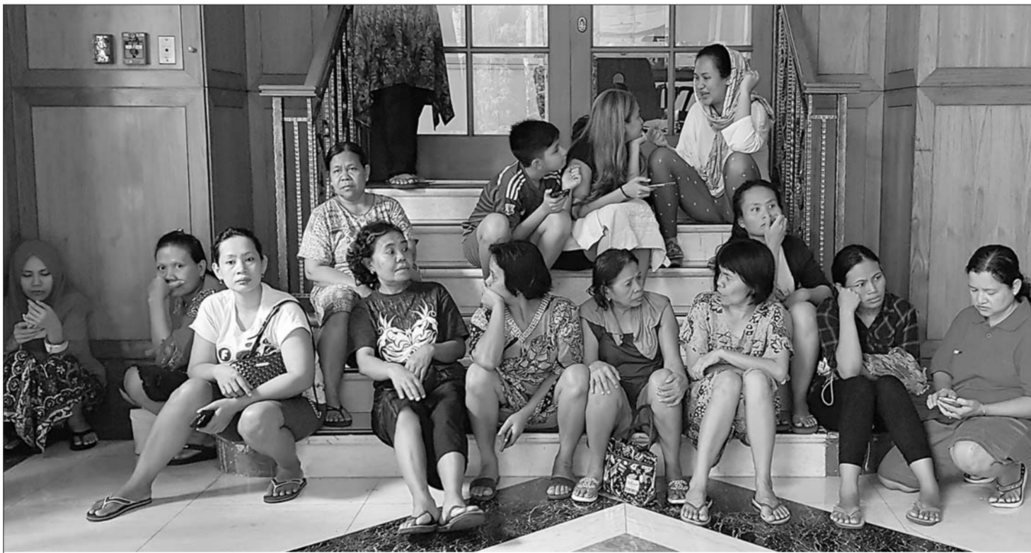
印尼海域地震 避难众生相