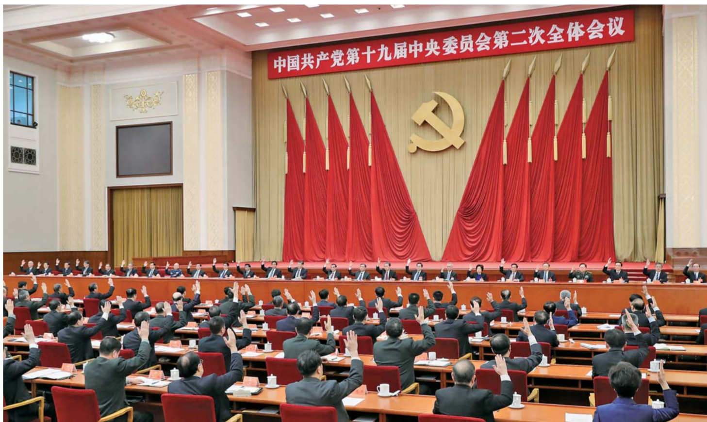
▲中国共产党第十九届中央委员会第二次全体会议，于2018年1月18日至19日在北京举行。中央政治局主持会议。

新华社北京1月19日电中国共产党第十九届中央委员会第二次全体会议公报 (2018年1月19日中国共产党第十九届中央委员会第二次全体会议通过)